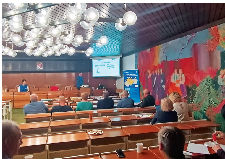
Stretnutia v Prešovskom kraji k príprave PZKO (Snina).