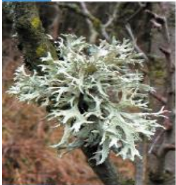
Evernia sp. Konárnik

Stielka je vláknitá, zo stromov visia tenké konáriky sivozelenej farby.