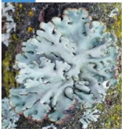
Hypogymnia sp. Diskovka

Laloky majú tvar sploštených konárikov. Ich vrchná strana je šedo-zelená, spodná strana je biela.