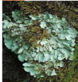
Flavoparmelia sp. Diskovka

Laloky sú matne hnedé, tesne priliehajú ku kôre. Pri trení sa na ich povrchu objavia svetlejšie oblasti.