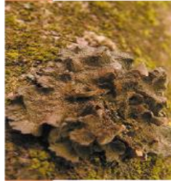
Melanelixia sp. Diskovka

Laloky sú matne hnedé, tesne priliehajú ku kôre. Pri trení sa na ich povrchu objavia svetlejšie oblasti.