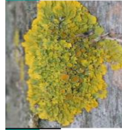
Xanthoria sp. Diskovnik

Lišajníky, ktoré uprednostňujú lokality s vyšším obsahom NO x