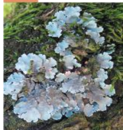
Parmelia sp. Diskovka

Široké laloky sú jablkovo zelenej farby, môže sa na nich vytvoriť zvrásnený povrch a hrubé práškovité škvrny.