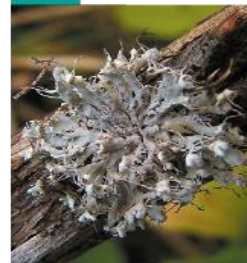
Physcia sp. Fyscia

Laloky sú malé, zoskupené, tesne prirastené k povrchu. Stielka je žltej až zelenosivej farby, s množstvom oranžových plodníc.