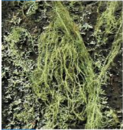
Usnea sp. Bradatec

Stielka je vláknitá, zo stromov visia tenké konáriky sivozelenej farby.