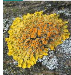
Xanthoria sp. Diskovnik

Laloky sú široké a rozťahnuté. Stielka je žltoranžová až zelenožltá, oranžové plodnice lišajníka nemusia byť vždy viditeľné.