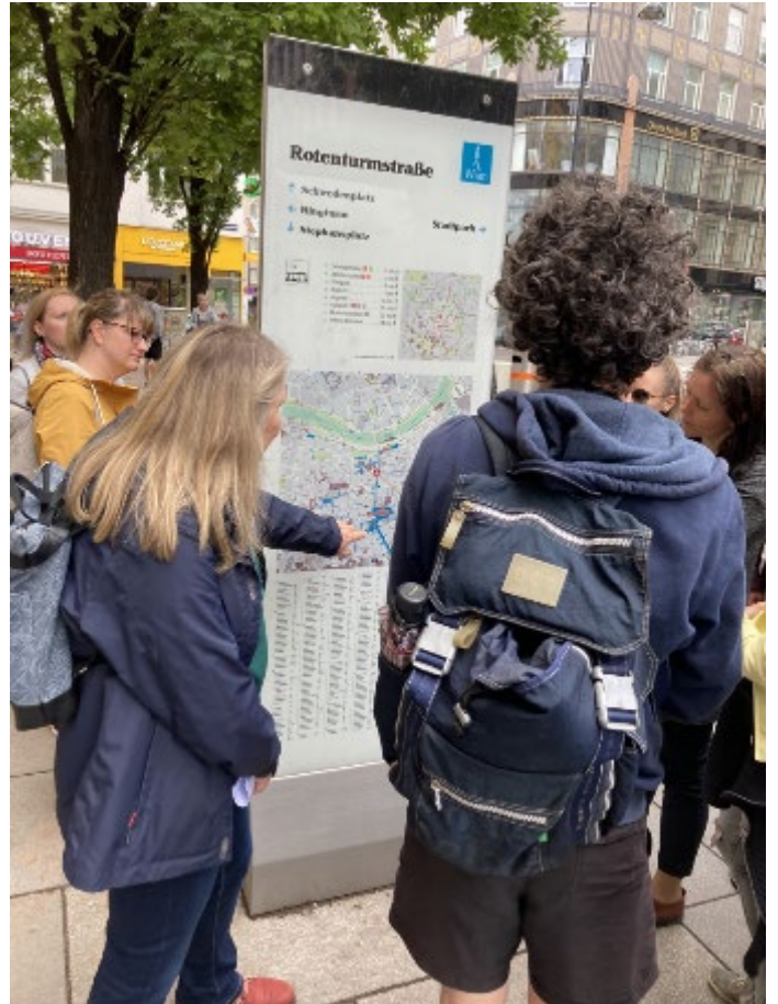
Účastníci študijnej cesty pred budovou ministerstva BMK vo Viedni