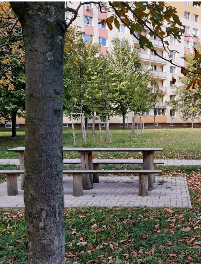
Dvory na Veternej