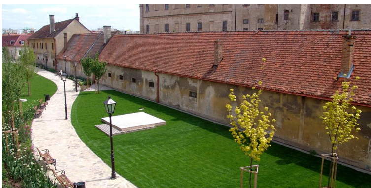
Parčík Bellu IV.