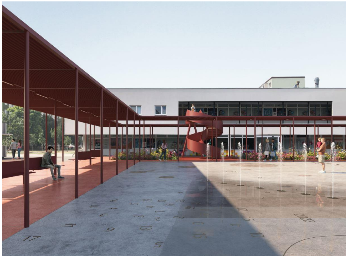
Revitalizácia sídliska Linčianska (ul. gen. Goliána) – 9 dvorov