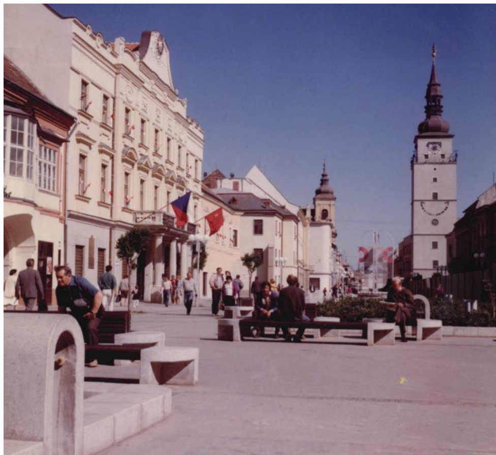
Pešia zóna na Hlavnej ulici - od roku 1990