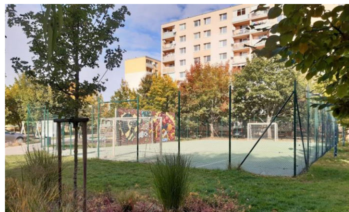
Dvory na Veternej