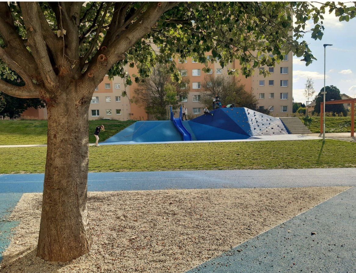
Dvor na Okružnej