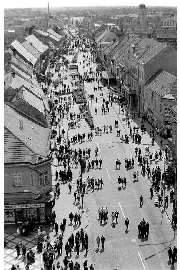
Hlavná ulica v 70 – tych rokoch