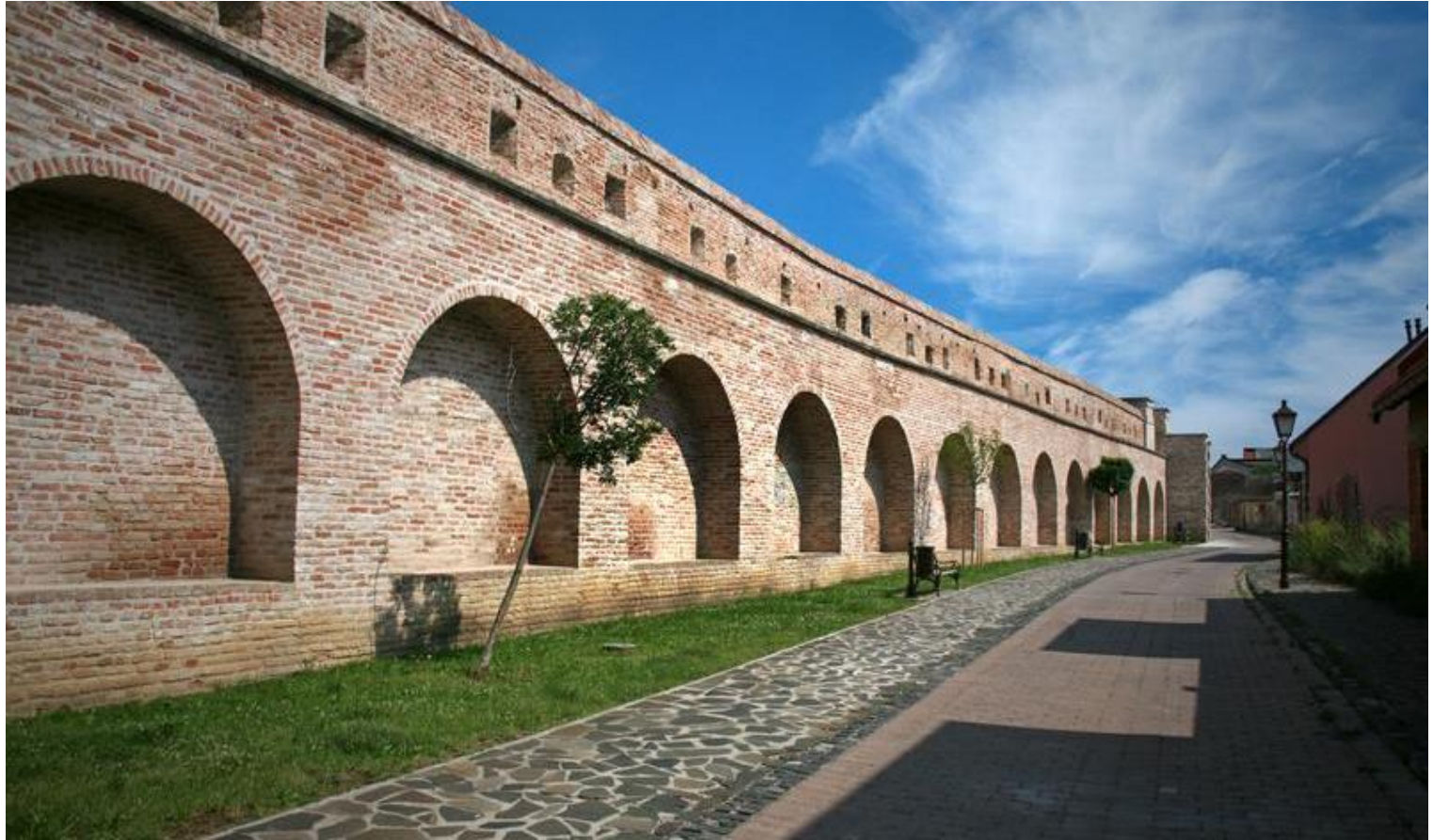
Michalská ulica - prechádzky, skratka aj možnosť si posediť