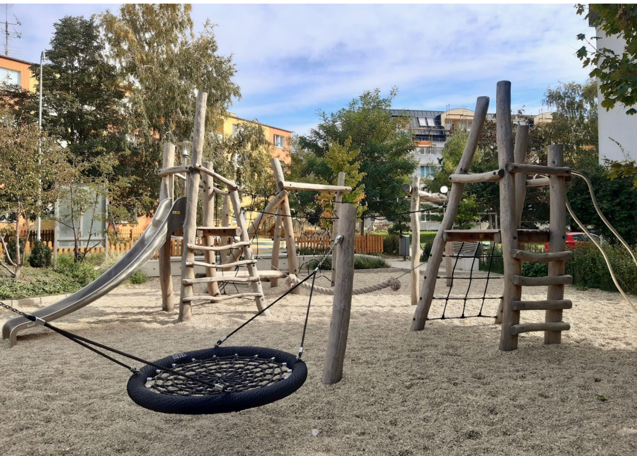
Vnútroblok na ul. Gejzu Dusíka