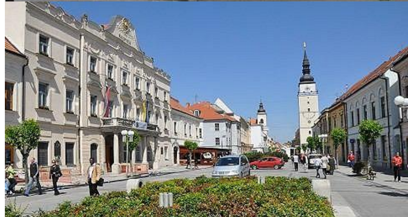
Stav Hlavnej ulice – peša zóna od roku 1990 – 2013