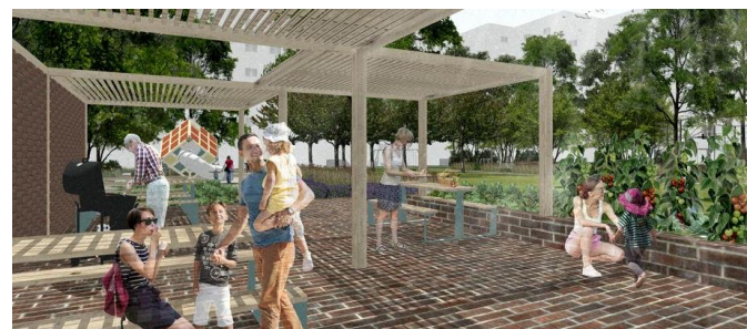
Tri Vnútrobloky na Tehelnej