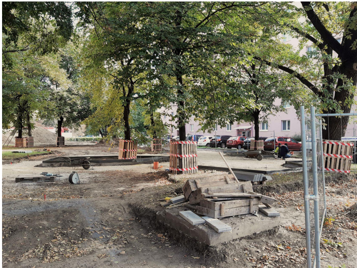
Dvory na Hospodárskej, práve v realizácii (október, 2021)