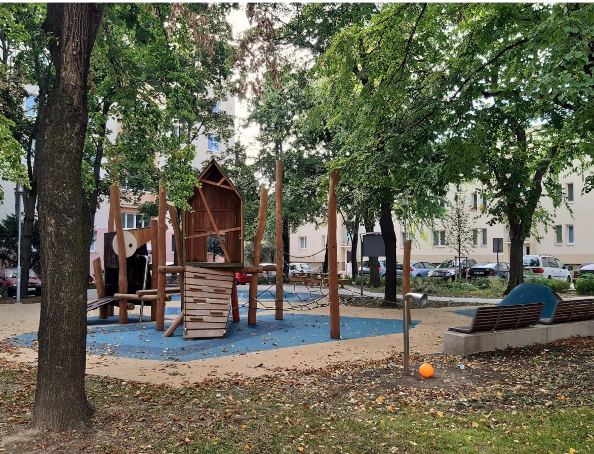
Dvor na Hospodárskej